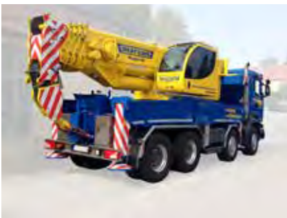
Kompakt-Autokran Individualisierter Alleskönner

Dabei spielt es keine Rolle, ob Sie nur mit Ihrem Bürokomplex, dem Lager und Maschinenpark oder einer Mischung aus diesen umziehen möchten. Unsere Experten entwickeln für Ihre individuelle Situation einen optimalen Umzugsplan und überwachen die Durchführung.