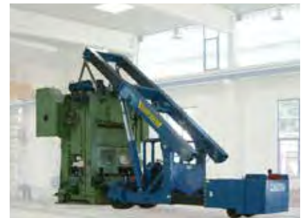
Twinlift Mobilkran Maximaler Hub, kaum Platzbedarf