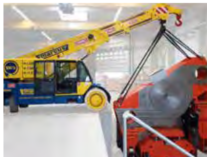
Fahrkrane Klein, wendig und leistungsstark